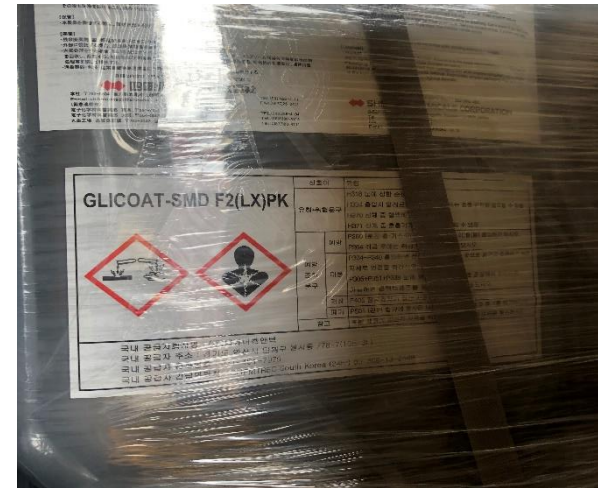
PSN 및 UN번호 미표시